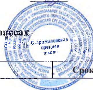
График оценочных процедур в 2–11-х классах на 2023/24 учебный год